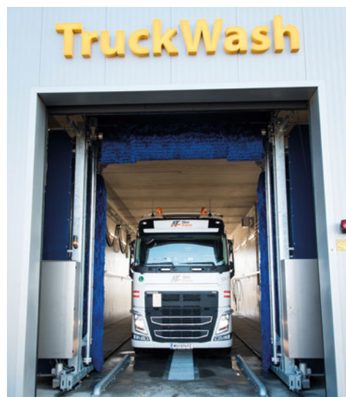
Neben einer Tankstelle steht auch eine Lkw-Waschanlage von WashTec zur Verfügung