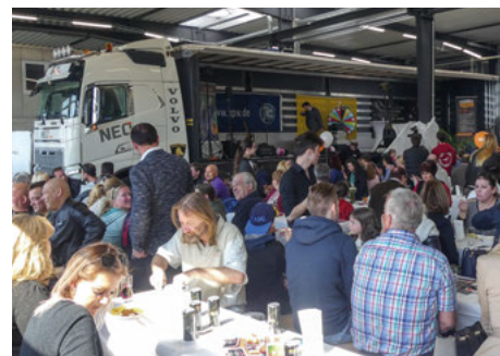
Mit einem großen Eröffnungsfest am 7. April erfolgte der Startschuss für allcartec, die neue Lkw-Werkstätte in Himberg bei Wien